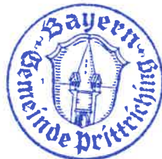
Alexander Ditsch Erster Bürgermeister