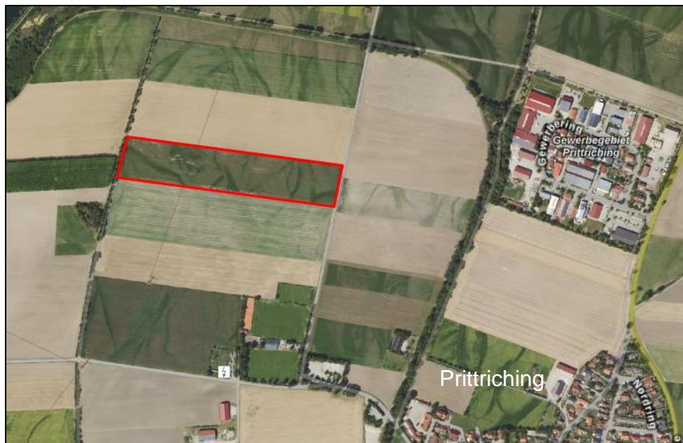
Abb. 1: Übersichtslageplan Umgriff Plangebiet

Der konkrete räumliche Geltungsbereich des Bebauungsplanes „Photovoltaikanlagen – Unteres Lechfeld Fl. Nr. 469, 469/1“ ergibt sich aus der Planzeichnung (Teil A). Er umfasst die Grundstücke Flur Nrn. 469 und 469/1, jeweils Gemarkung Prittriching. Zur Gewährleistung einer ordnungsgemäßen Erschließung wurde zudem auch noch eine Teilfläche des östlich der Grundstücke vorhandenen öffentlich gewidmeten landwirtschaftlichen Anwandweges (Flur Nr. 474, Gemarkung Prittriching) in den Umgriff des Bebauungsplanes einbezogen.