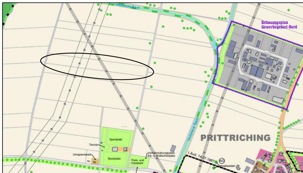
Abb. 4: Auszug aus dem wirksamen FNP der Gemeinde Prittriching

Der Bebauungsplan „Photovoltaikanlagen – Unteres Lechfeld Fl. Nr. 469, 469/1“ kann somit gemäß § 8 Abs. 2 BauGB künftig aus den Darstellungen des geänderten Flächennutzungsplanes der Gemeinde Prittriching entwickelt werden.